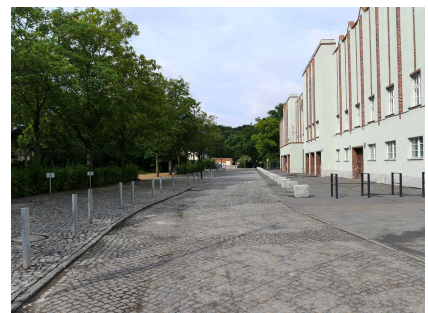
Temporäre Parkplätze vor dem denkmalgeschützten Gebäude