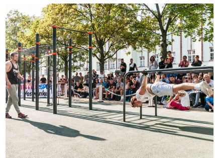
Anspruchsvolle Geräte für ambitionierte Freizeitsportler