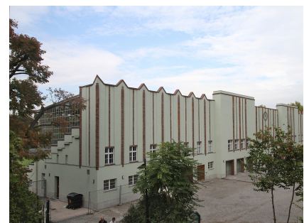
Das Tribünengebäude mit dem Haupteingang 2014