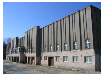
Das Gebäude vor der Sanierung