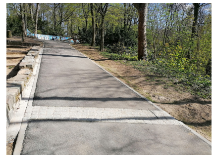
Der Weg am Bergspielplatz wurde neu asphaltiert und längs durch Mulden ergänzt