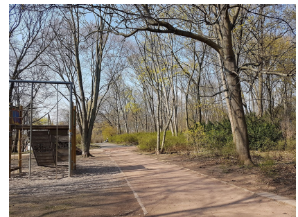
Ausspülungen an der Fitnessstrecke vor Projektbeginn