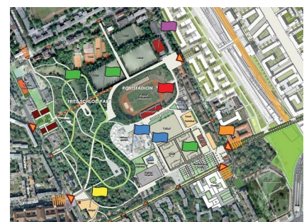
Der Park wird im Rahmen des Stadtumbaus systematisch entwickelt