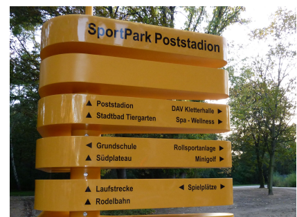
Die Stelen verweisen auf die Parkeingänge und die vielen Möglichkeiten im Sportpark Poststadion