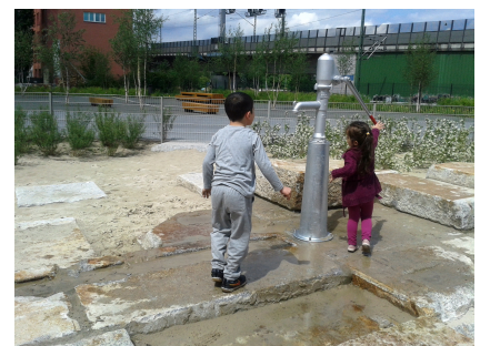
Auf dem Wasserspielplatz wurden Granitblöcke der alten Marmor- und Granitfabrik verarbeitet