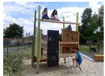
Das Spielhaus mit Maltafel