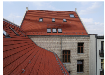
Dach und Hoffassaden nach denkmalgerechter Sanierung