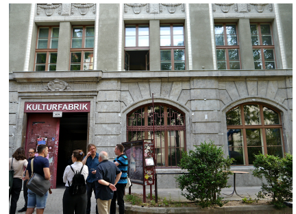
Die Außenhülle der Kulturfabrik an der Lehrter Straße wurde saniert