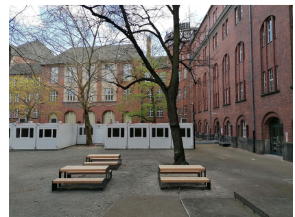
Das neue Mobiliar wurde von Schülerinnen und Schülern ausgewählt