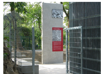
Infosteile am Eingang / Aussichtsturm beleuchtet