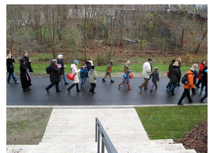
Der Nord-Süd-Grünzug mit Aufgang zur Bautzener Straße