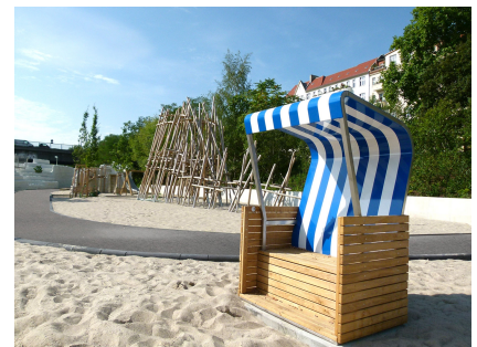
Die Spielfläche repräsentiert deutsche Landschaften von der Ostsee bis zu den Alpen