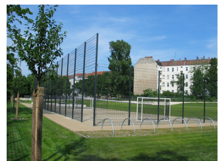
Der neue Bolzplatz