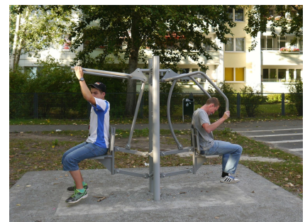
Fitness-Trainer für alle Generationen