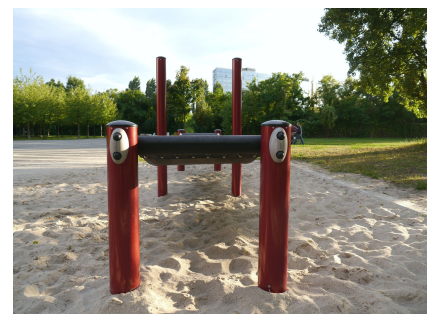
Der Gurtsteg lässt sich vielfältig verwenden