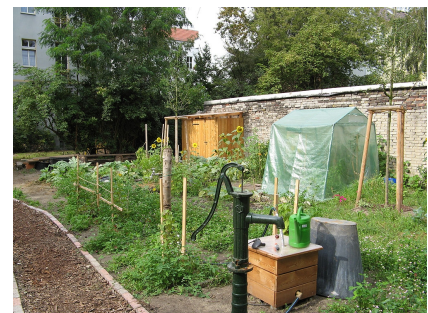
Ein Ort zum Pflanzen und Ernten