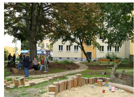
Und viel Platz zum Spielen