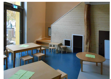
Farbenfroher Gruppenraum der Kita im ehemaligen Kirchenraum