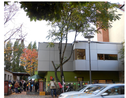
Die Fassade des JuFaZ an der Eitelstraße