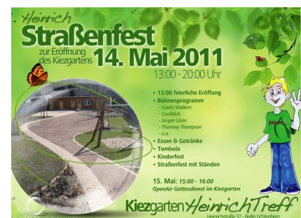
Plakat zur Eröffnung 2011