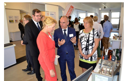
Die Veranstaltungen des Netzwerks sind gut besucht