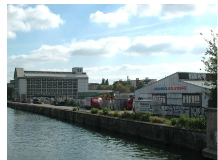
Der alte Standort am Kreuzberger Spreeufer