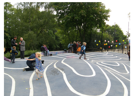
Die neue Eingangsgestaltung an der Straße "Vor dem Schlesischen Tor"