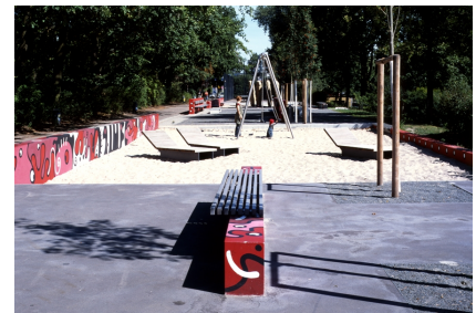
Das Sport- und Spielband