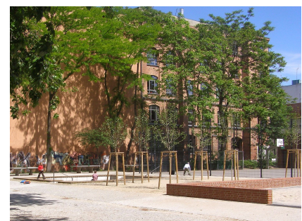
Der neue Pavillonhof