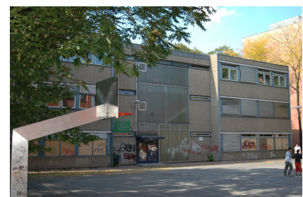
Dieser Anbau wurde abgerissen

Quelle: hochC LANDSCHAFTSARCHITEKTEN, Bezirksamt Friedrichshain-Kreuzberg, Fotos: hochC LANDSCHAFTSARCHITEKTEN, Herwarth + Holz, bearb. Herwarth + Holz, A. Stahl Stand: April 2024