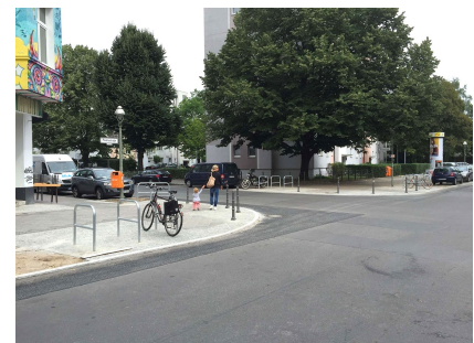
Gehwegvorstreckungen mit Fahrradbügeln an der Markthalle IX