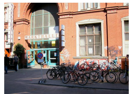
Die Situation am Eingang der Markthalle vor der Umgestaltung