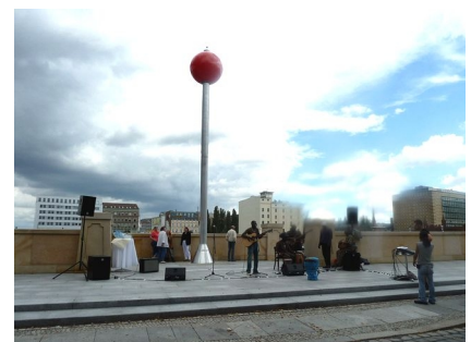
Podest mit Signalkugel von der Landseite gesehen