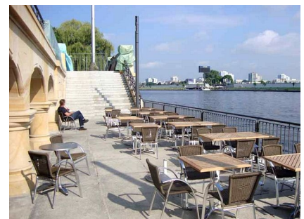
Die neue Restaurantterrasse an der Kaianlage