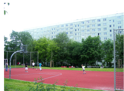
Der neue Bolzplatz