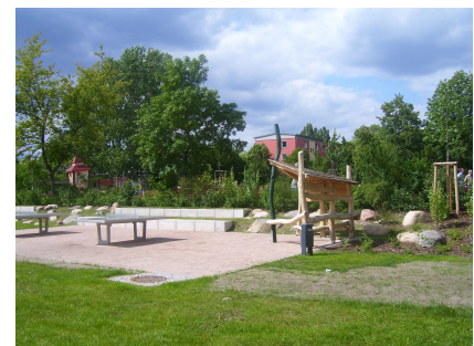
Tischtennisplatten und Treffpunkt im mittleren Bereich des Quartiersparks