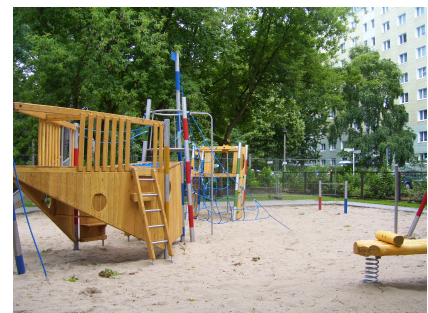
Der neue Kleinkinder-Spielplatz