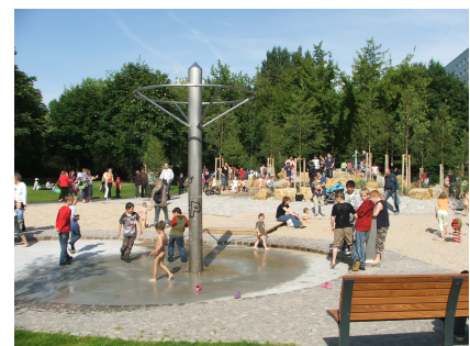
Die Plansche wurde komplett erneuert