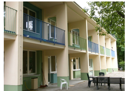
Loggien an der Gartenfassade