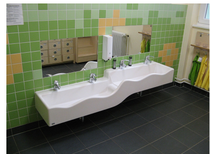
Neuer Waschraum mit Köpfchen eingerichtet