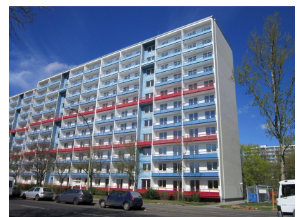
Teilsanierter Elfgeschoss des Typs P2