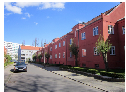
Frühe Typenbauten aus dem Jahr 1928 in der Splanemann-Siedlung