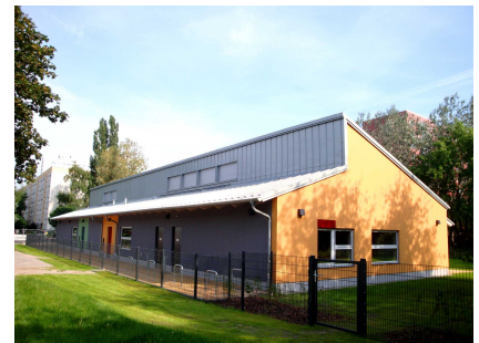
Die Vorderseite mit den 2 Eingängen