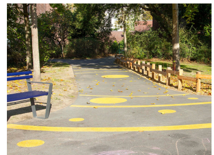
Die Asphaltwege zeigen das Planetensystem