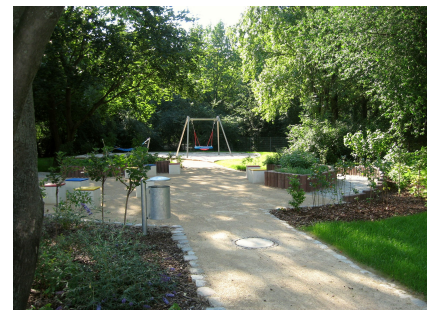
Der Eingang zum Naschgarten im bisher nicht genutzten Teil der Freiflächen