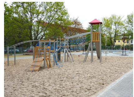
Kletterkombination auf dem neu gestalteten Schulhof