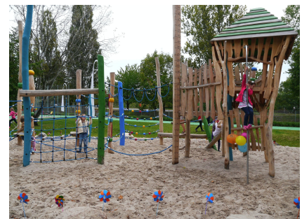
Die neue Kletterkombination