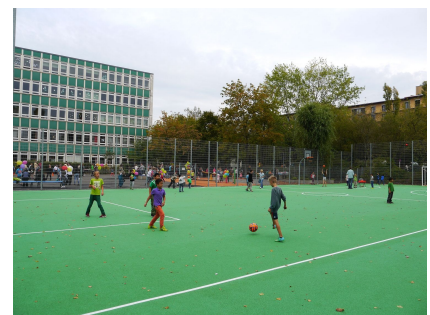
Viel Platz für Sport und Spiel