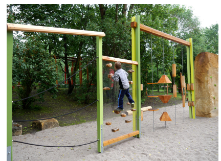
Der Kletter- und Balancierparcours im Grünen ist anspruchsvoll