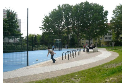
Bolzplatz im Zentrum des Quartiersparks