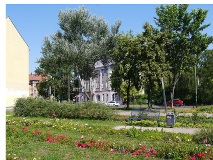
Grünfläche mit Bänken und Blick zur Hauptstraße