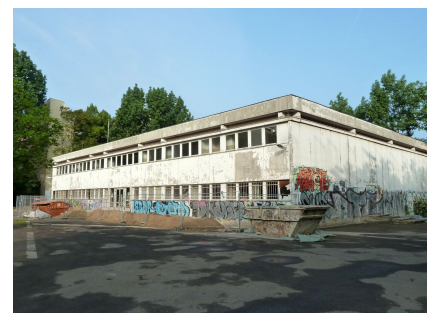
Zuerst wurden Risse unter dem Hallenboden verfüllt und ein Frostschutz eingebaut