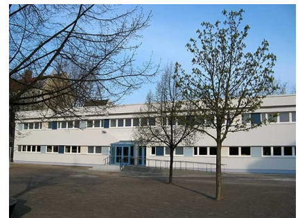
Die sanierte Sporthalle auf der Schulhofseite