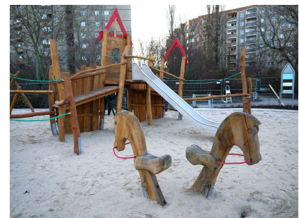
Hölzerne Pferde passen zum Märchenschloss