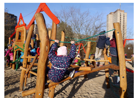
Der Kletter- und Hangelparcours verlangt Geschicklichkeit