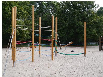
Der "Kleine Kletterwald" auf dem Plateau