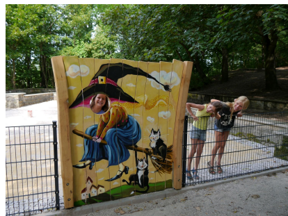
Der Kleinkinderspielplatz am Gärtnerstützpunkt