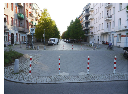
Die Kopenhagener Straße wurde von der Schwedter Straße abgekoppelt, um den Verkehr in der Wohnstraße zu begrenzen