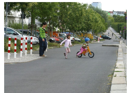
Gehwegvorstreckungen erleichtern allen das Queren der Fahrbahn