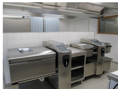
Moderne Großgeräte erleichtern die Arbeit in der Kitaküche