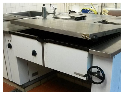
Die alten Geräte waren ergonomisch ungünstige Energiefresser