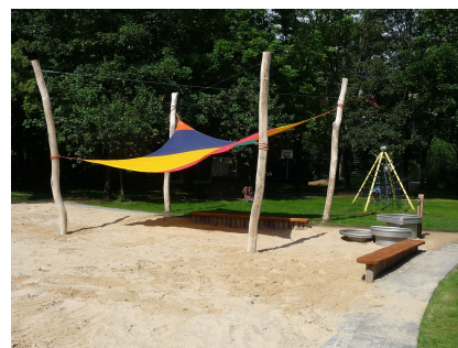
"Vogeltränke" mit Sonnensegel