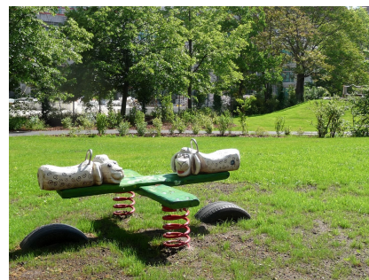
Neue Wippe auf dem "Bauernhof"