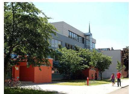
Das Gebäude wurde saniert und aufgestockt