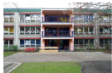
Die Fassade an der Gartenseite vor Projektbeginn