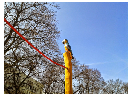
Detail am aufgewerteten Helmholtzplatz