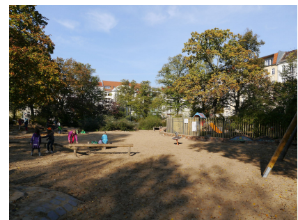
Der Helmholtzplatz vor der Qualifizierung

Stand: April 2024