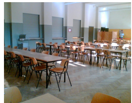
Blick in die Mensa