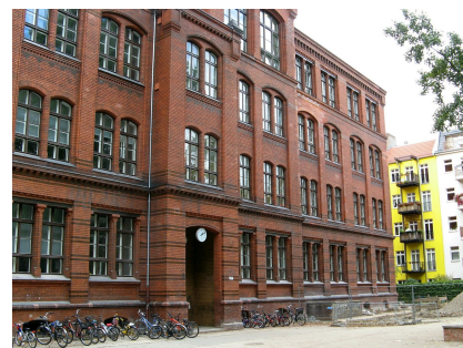
Der Eingang des Schulgebäudes im Innenhof