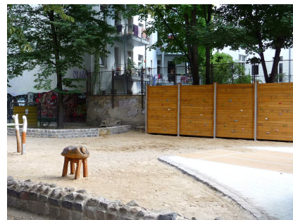
Boulderwand und kleiner Bock im Bewegungsteil des Vorderhofes