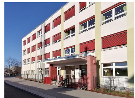
Die Grundschule am Planetarium mit neuer Fassadengestaltung