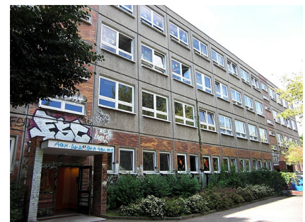
Die Schule vor der Sanierung