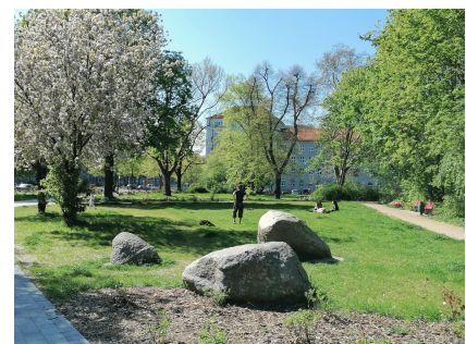
Ein grüner Ort für Entspannung, Spiel und Sport