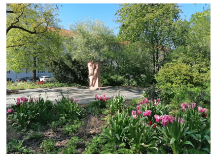
Der Platz um das Mahnmal wurde aufgewertet