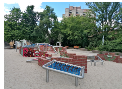
Der Spielplatz mit Klettermöglichkeiten zwischen den geschützten Klinkermauern