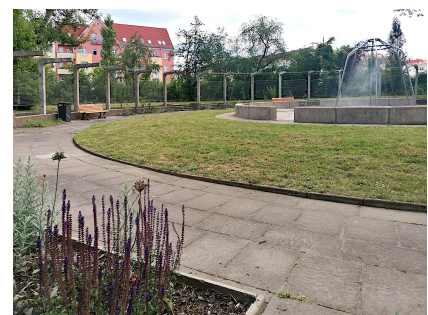
Die Grünfläche mit Pergola und Sprühplansche