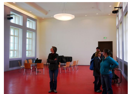
Die Aula und das historische Treppenhaus A