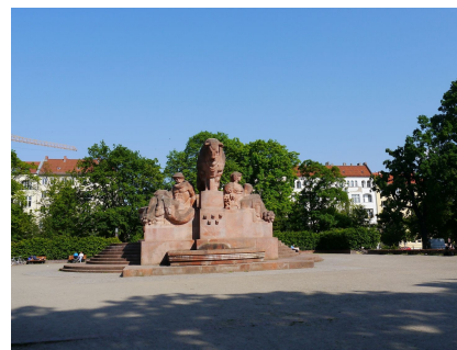
Das Plateau mit dem "Stierbrunnen"