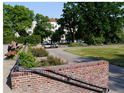
Die Bepflanzung wurde denkmalgerecht erneuert