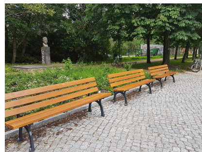
Am Denkmal für Anton-Saefkow wurde ein kleiner Platz geschaffen