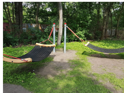
Im Grünzug kann man nun gemütlich "abhängen"