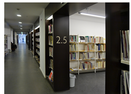
Bücherregale im ehemaligen Schulflur