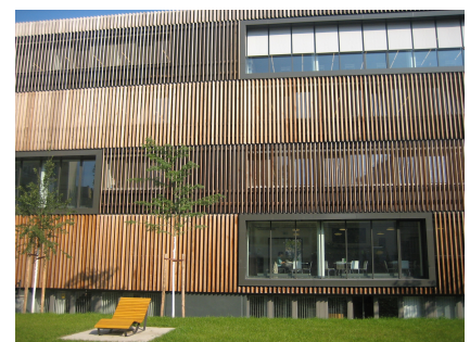
Der Typenbau erhielt eine Holzlamellenfassade