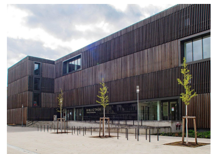
Der neu gestaltete Vorplatz der Zentralen Bezirksbibliothek