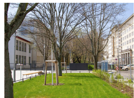
Blick in Richtung Händelgymnasium und Wohnbebauung der 1950er-Jahre