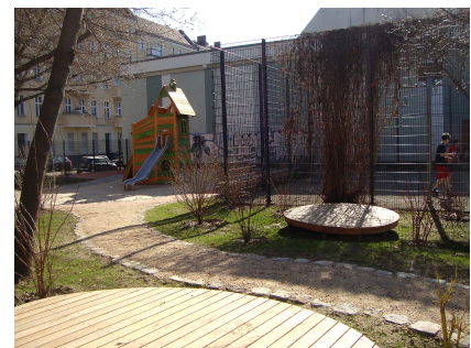
Die neue Spielfläche für die Kita-Kinder am Dathe-Gymnasium